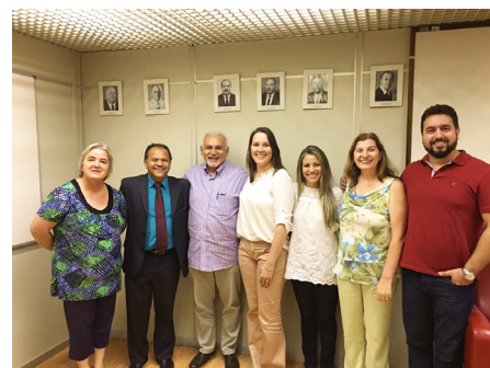
A visita foi acompanhada pela Direção do Setor e pelas docentes do Curso.