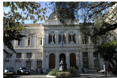
A Universidad Nacional de La Plata - Argentina, é uma das instituições associadas ao grupo Montevideo.

As inscrições estão abertas até o dia 23 de abril e podem participar alunos da UFPR que possuam IRA maior de sete, tenham no máximo uma reprovação, possuam uma carga horária de 120h de curso de espanhol, entre outras condições.