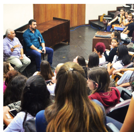
Os representantes do MEC em reunião com os estudantes de Fisioterapia no Anfiteatro 10.

Bionews é um boletim eletrônico de publicação semanal do Setor de Ciências Biológicas da UFPR