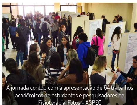
A jornada contou com a apresentação de 64 trabalhos acadêmicos de estudantes e pesquisadores de Fisioterapia.

Curitiba e os 48 anos do reconhecimento da profissão também foram citados pelos integrantes da mesa.