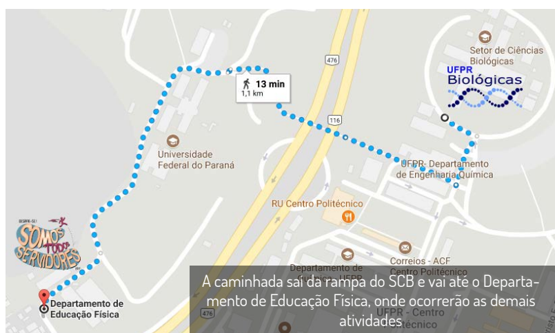
A caminhada sai da rampa do SCB e vai até o Departamento de Educação Física, onde ocorrerão as demais atividades.

Os preparativos para a quarta edição do evento Somos Todos Servidores estão a todo o vapor! O grupo de alunos do GE- PLEC (Grupo de Estudo e Pesquisa em Lazer, Espaço e Cidade do Departamento de Educação Física da UFPR) já está finalizando todas as atividades que serão propostas para a ocasião. Ainda não confirmou sua presença? Você pode fazê-lo pela Facebook ( facebook.com/blufpr ), pelo email aspec.bio@ufpr.br ou na lista que está na Direção do Setor. É na próxima sexta-feira, dia 20, com saída da rampa de entrada do SCB a partir das 14h.