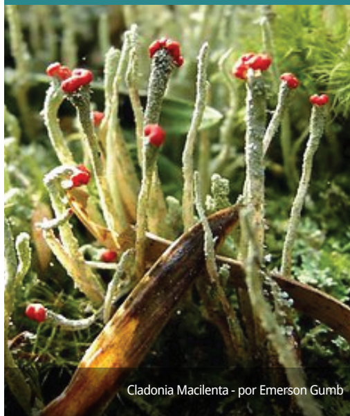
Cladonia Macilenta - por Emerson Gumb