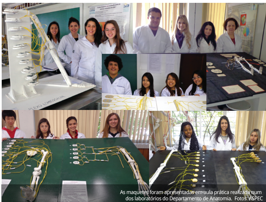
As maquetes foram apresentadas em aula prática realizada num dos laboratórios do Departamento de Anatomia.

Segundo a docente, a atividade é muito importante para o aprendizado, pois promove proatividade, discussão e reunião em grupos. "A construção de maquetes é um método facilitador da aprendizagem. Possibilita diversificar as formas didáticas de apreensão da realidade, contribui para o aprendizado da ciência anatômica e busca minimizar dificuldades na interpretação da constituição dos plexos nervosos e seu território de inervação, representados nas três dimensões da maquete."