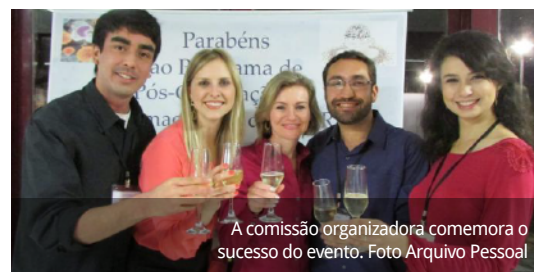
A comissão organizadora comemora o sucesso do evento.

Durante os três dias de evento, organizado inteiramente pelos doutorandos, os participantes puderam assistir a apresentações orais e banners dos alunos, mesas redondas com professores da UFPR e palestras sobre as áreas de pesquisa da Farmacologia.