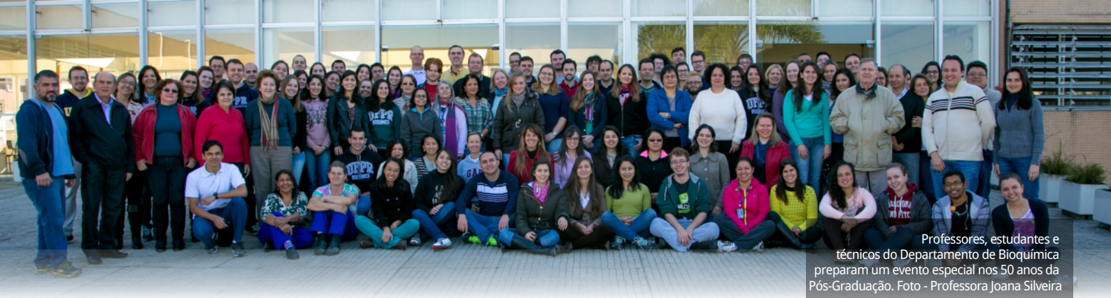
Professores, estudantes e técnicos do Departamento de Bioquímica preparam um evento especial nos 50 anos da Pós-Graduação.