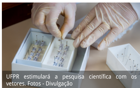
UFPR estimulará a pesquisa científica com os vetores.

DENUNCIE FOCOS DE INFESTAÇÃO DO MOSQUITO AEDES NA UFPR.