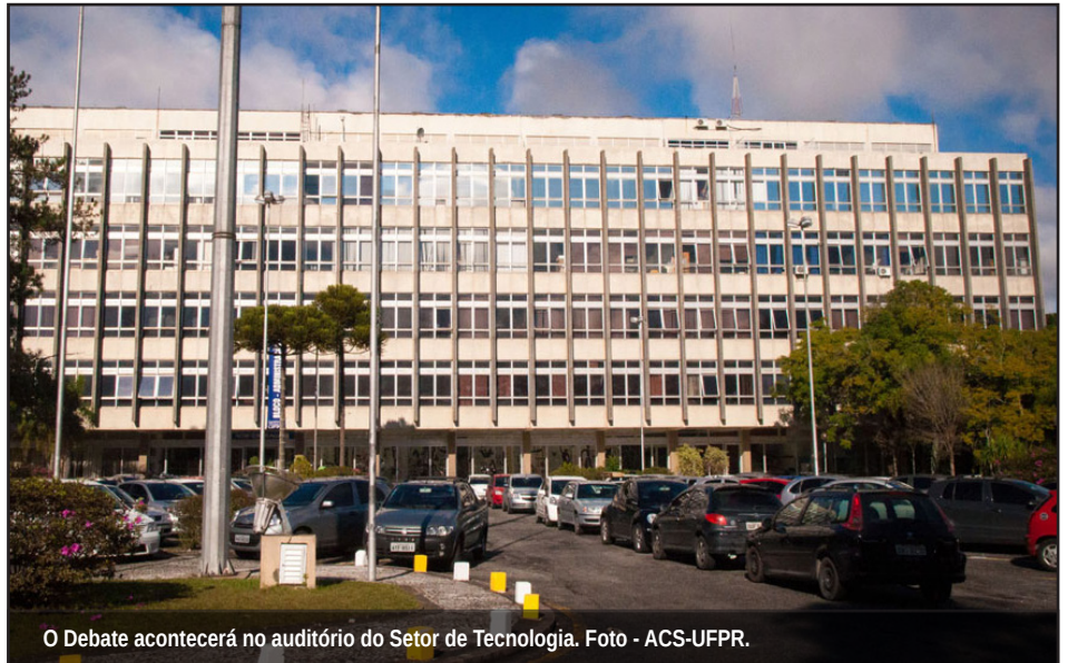
O Debate acontecerá no auditório do Setor de Tecnologia.

(PRPPG), de Planejamento, Administração e Finanças (PROPLAN), da Fundação da Universidade Federal do Paraná (FUNPAR), da Agência de Inovação Tecnológica (AGITEC) e da Procuradoria Federal Especializada da UFPR.