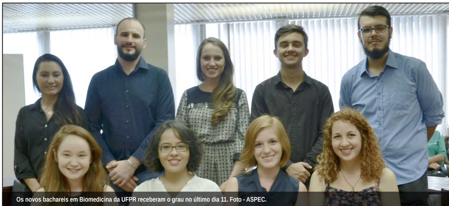
Os novos bachareis em Biomedicina da UFPR receberam o grau no último dia 11.

Desejamos a todos os formandos, muito sucesso e persistência nas novas jornadas!