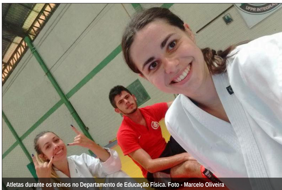
Atletas durante os treinos no Departamento de Educação Física.

Saiba mais sobre o projeto na página https://www.facebook.com/KARATE-UFPR-1410631102598866/?fref=ts