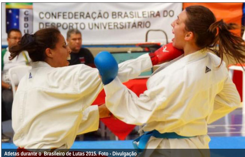
Atletas durante o Brasileiro de Lutas 2015.