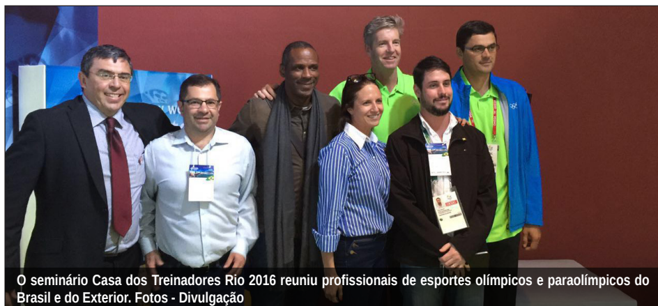
O seminário Casa dos Treinadores Rio 2016 reuniu profissionais de esportes olímpicos e paraolímpicos do Brasil e do Exterior.