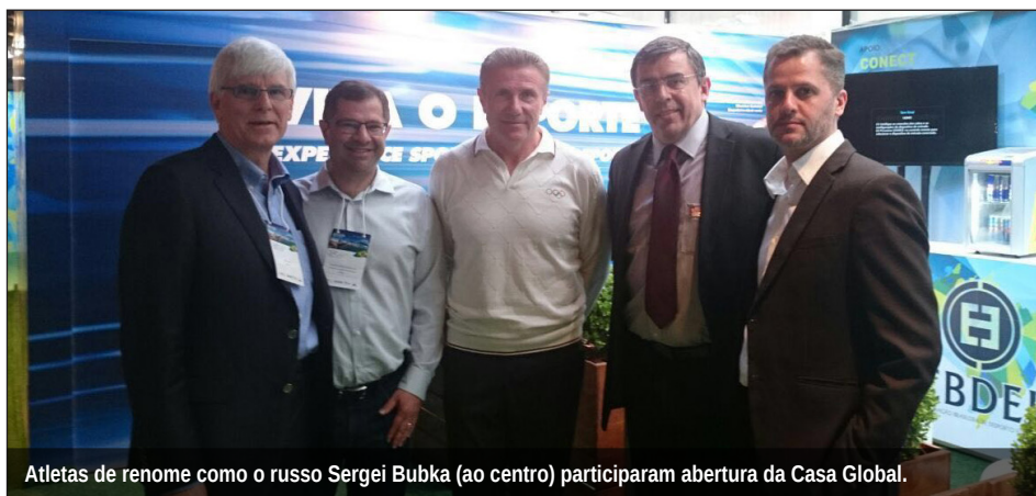
Atletas de renome como o russo Sergei Bubka (ao centro) participaram abertura da Casa Global.

O evento prosseguiu até o dia 11 de agosto e a UFPR foi a promotora do evento. Mais informações sobre a Casa Global de Treinadores estão no site www.globalcoacheshouse.net e http://www.brasil2016.gov.br/pt-br/casabrasil