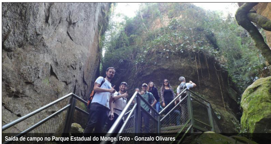
Saída de campo no Parque Estadual do Monge.

O evento foi dividido em parte teórica - com palestras e debates com representantes de instituições como ICMBio, IAP, SPVS e IBAMA - e prática, com visitas guiadas a duas Unidades de Conservação com diferentes modelos de gestão, no município da Lapa: o Parque Estadual do Monge e a Reserva Particular do Patrimônio Natural Mata do Uru.