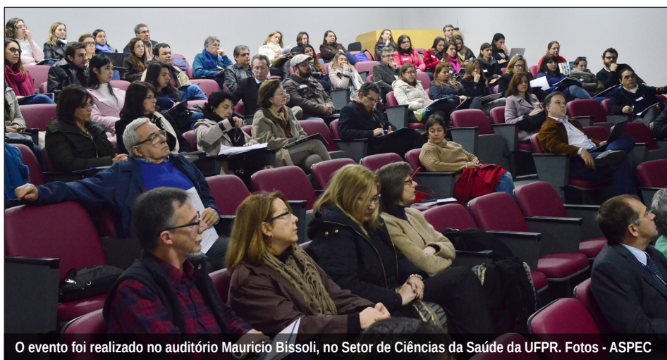
O evento foi realizado no auditório Mauricio Bissoli, no Setor de Ciências da Saúde da UFPR.