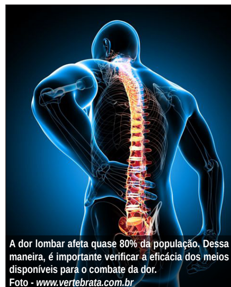
A dor lombar afeta quase 80% da população. Dessa maneira, é importante verificar a eficácia dos meios disponíveis para o combate da dor.