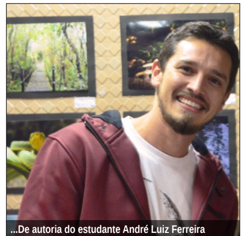
...De autoria do estudante André Luiz Ferreira