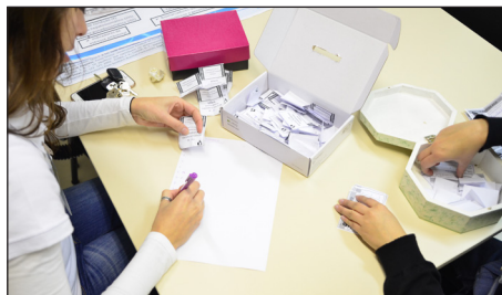
No último dia, a comissão organizadora fez a contagem dos votos dos concursos. Os participantes puderam escolher o melhor bolo e a melhor foto durante a mostra de banners.