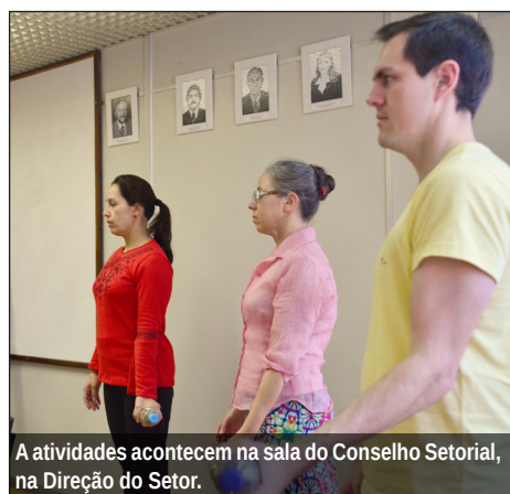
A atividades acontecem na sala do Conselho Setorial, na Direção do Setor.

As aulas acontecem todas as segundas e sextas-feiras. Durante vinte minutos, os alunos ministram exercícios de alongamento, fortalecimento e relaxamento. As atividades são parte do Projeto de Conclusão de Curso “Cinesioterapia Laboral nos Servidores da UFPR”.