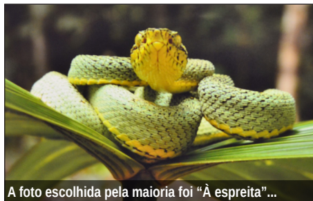
A foto escolhida pela maioria foi “À espreita”...