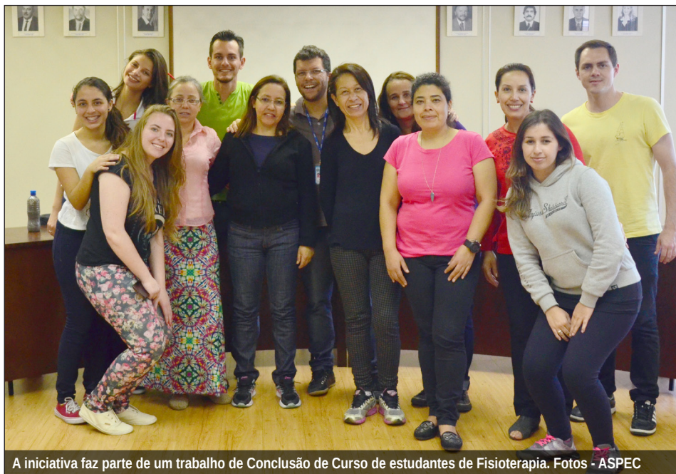
A iniciativa faz parte de um trabalho de Conclusão de Curso de estudantes de Fisioterapia.

Lima (9835-0561 – raiane.s.l@hotmail.com ) para uma avaliação antes do início das atividades, a fim de verificar as condições físicas antes e depois da intervenção.