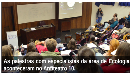
As palestras com especialistas da área de Ecologia aconteceram no Anfiteatro 10.