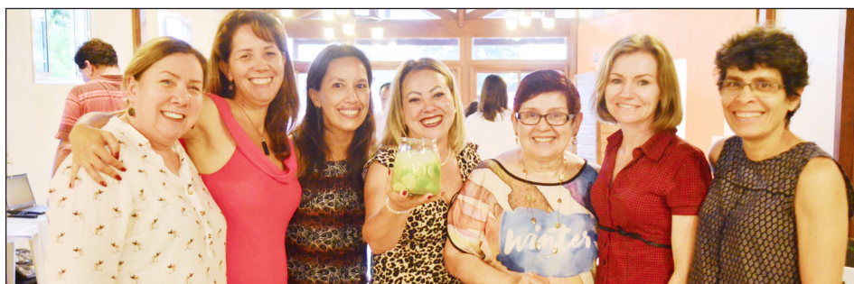
Confraternização do SCB, realizada na Asufepar no último dia 8.