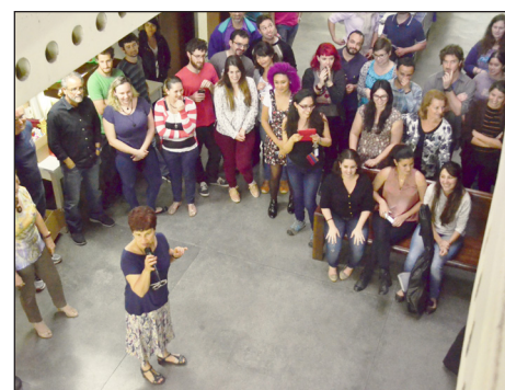
Confraternização do Departamento de Zoologia ocorrida no último dia 12, que teve uma mostra de talentos, com destaque para a apresentação de dança tradicional da Colômbia feita por estudantes da pós-graduação.