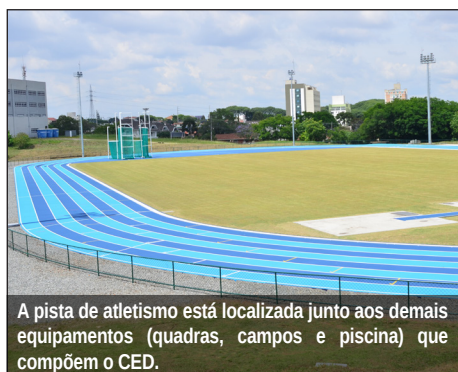
A pista de atletismo está localizada junto aos demais equipamentos (quadras, campos e piscina) que compõem o CED.