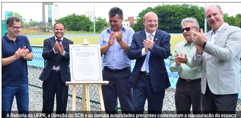
A Reitoria da UFPR, a Direção do SCB e as demais autoridades presentes comemoram a inauguração do espaço