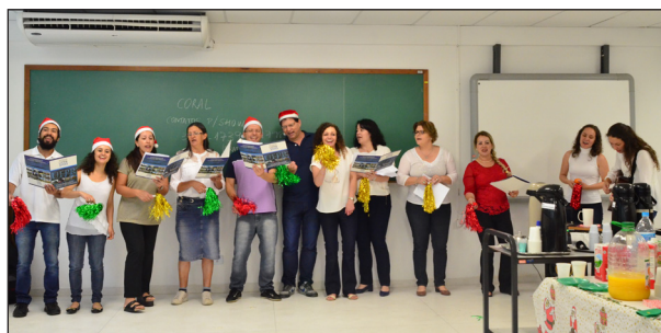
Confraternização no Departamento de Farmacologia, que teve uma apresentação de coral feita por servidores, técnicos e estudantes na manhã da última sexta-feira, 9.