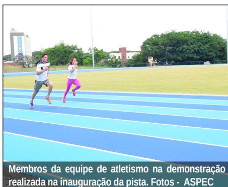
Membros da equipe de atletismo na demonstração realizada na inauguração da pista.