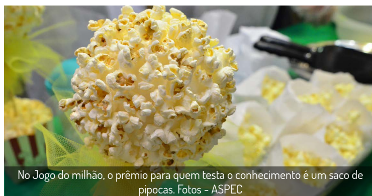
No Jogo do milhão, o prêmio para quem testa o conhecimento é um saco de pipocas.