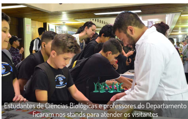
Estudantes de Ciências Biológicas e professores do Departamento ficaram nos stands para atender os visitantes

Confira outras fotos do evento no link - http://goo.gl/d4KsJv