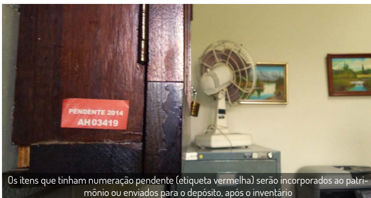
Os itens que tinham numeração pendente (etiqueta vermelha) serão incorporados ao patrimônio ou enviados para o depósito, após o inventário

Comissões do SCB trabalham para contabilizar 100% dos bens