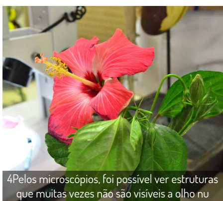
4Pelos microscópios, foi possível ver estruturas que muitas vezes não são visíveis a olho nu

Começou nesta segunda a Mostra “75 anos da Botânica na UFPR”, como uma das formas de comemorar e prestigiar a trajetória do Departamento. O evento conta com exposições e atividades lúdicas que ensinam sobre as diversas áreas da botânica.