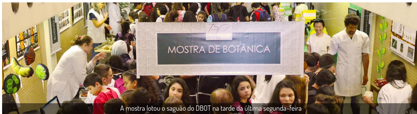
A mostra lotou o saguão do DBOT na tarde da última segunda-feira

Evento fica aberto à visitação até a próxima sexta-feira, dia 22