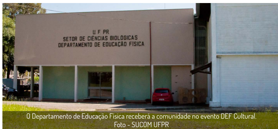
O Departamento de Educação Física receberá a comunidade no evento DEF Cultural.

A programação conta com apresentações dos atletas, além de palestras e minicursos, de circo, yoga, ballet e defesa pessoal. O evento tem apoio do