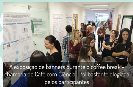
A exposição de banners durante o coffee break chamada de Café com Ciência - foi bastante elogiada pelos participantes

Os temas para as palestras (Canabinóides, Sistema Imune, CYP450 e PI3K) foram escolhidos baseados nos "Hot Topics" da União Internacional de Farmacologia Básica e Clínica. De acordo com os organizadores, o envolvimento dos alunos na organização e uma grande divulgação nas redes sociais fizeram com que a procura se intensificasse, e as vagas acabassem em apenas três dias. A equipe também recebeu sugestões para um evento mais longo e recebeu elogios pelo "café com ciência", que juntou, no mesmo espaço, a apresentação de banners e o coffee break, intensificando a interação entre os participantes.