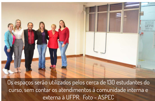
Os espaços serão utilizados pelos cerca de 130 estudantes do curso, sem contar os atendimentos à comunidade interna e externa à UFPR.