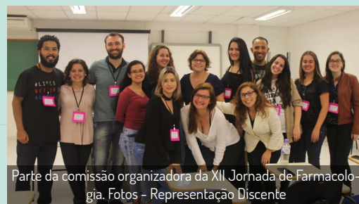
Parte da comissão organizadora da XII Jornada de Farmacologia.

Nos dias 26 e 27 de outubro, ocorreu a 12ª Edição da Jornada de Farmacologia, organizada pela representação discente do Programa de Pós-Graduação em Farmacologia da UFPR. O evento teve o intuito de oferecer espaço para que assuntos atuais sobre farmacologia sejam abordados, além de possibilitar a apresentação de trabalhos em formato de plataforma oral e banner em um evento científico. Neste ano a Jornada contou, pela primeira vez, com a apresentação de banners de alunos de iniciação científica, além da abertura para participação da comunidade externa ao PPG-Farmacologia e à UFPR.