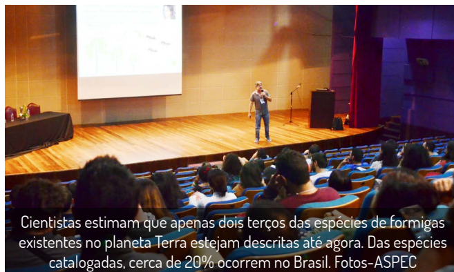
Cientistas estimam que apenas dois terços das espécies de formigas existentes no planeta Terra estejam descritas até agora. Das espécies catalogadas, cerca de 20% ocorrem no Brasil.

Nos cinco dias de evento, mais de 360 especialistas em insetos sociais de 116 instituições de pesquisa, de 18 países, compartilharam conhecimento e estabeleceram parcerias técnico-científicas.