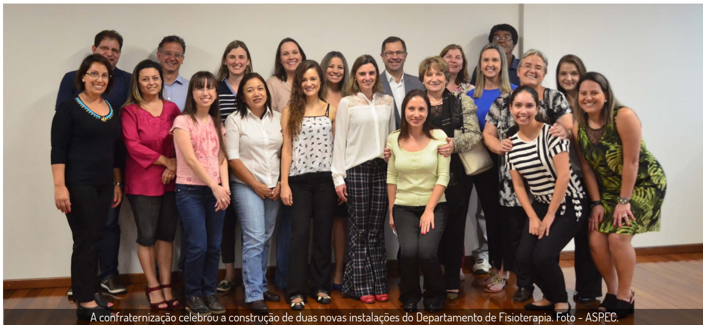
A confraternização celebrou a construção de duas novas instalações do Departamento de Fisioterapia.

A vice-reitora, o Pró-reitor de Planejamento e Finanças e o próximo diretor do SCB conheceram as instalações