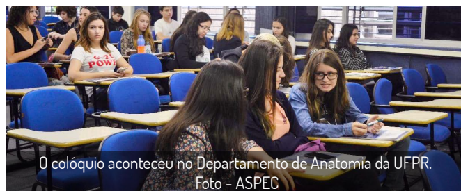
O colóquio aconteceu no Departamento de Anatomia da UFPR.

O Centro Acadêmico de Biomedicina (CABIOM), em parceria com o Departamento de Anatomia da UFPR, realizou no último sábado (25) o I Colóquio e I Mostra de trabalhos Científicos da Biomedicina da UFPR. O evento, que ocorreu no Departamento de Anatomia, no Politécnico, teve o objetivo de promover a troca de conhecimento e experiências entre os estudantes de Biomedicina da UFPR e outras instituições.