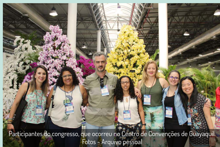
Participantes do congresso, que ocorreu no Centro de Convenções de Guayaquil.