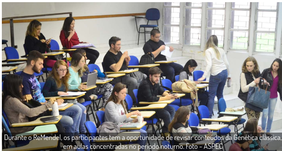
Durante o ReMendel, os participantes tem a oportunidade de revisar conteúdos da Genética clássica, em aulas concentradas no período noturno.

Além disso, foram introduzidas mudanças na grade curricular, como a nova disciplina de “Mutações e reparo” e o aumento nas cargas horárias das aulas de “Princípios de Genética Molecular” e “Ligações Gênicas.”