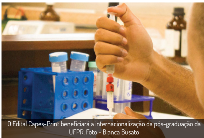
O Edital Capes-Print beneficiará a internacionalização da pós-graduação da UFPR.

Ao final de dois anos, a Capes fará uma avaliação para verificar se a aplicação está sendo feita de acordo com o plano e os seus resultados obtidos. A instituição ainda não divulgou quanto cada projeto receberá, mas a expectativa é que a verba esteja disponível ainda em 2018.