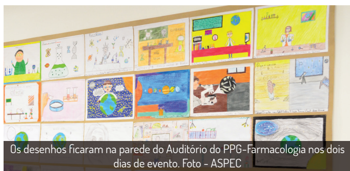
Os desenhos ficaram na parede do Auditório do PPG-Farmacologia nos dois dias de evento.