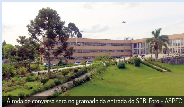
A roda de conversa será no gramado da entrada do SCB.