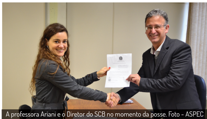
A professora Ariani e o Diretor do SCB no momento da posse.