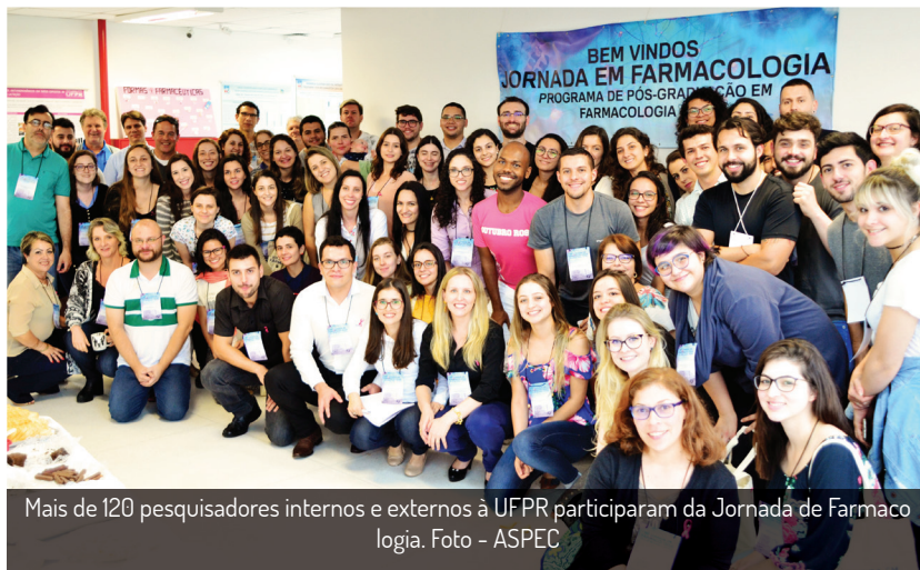
Mais de 120 pesquisadores internos e externos à UFPR participaram da Jornada de Farmacologia.