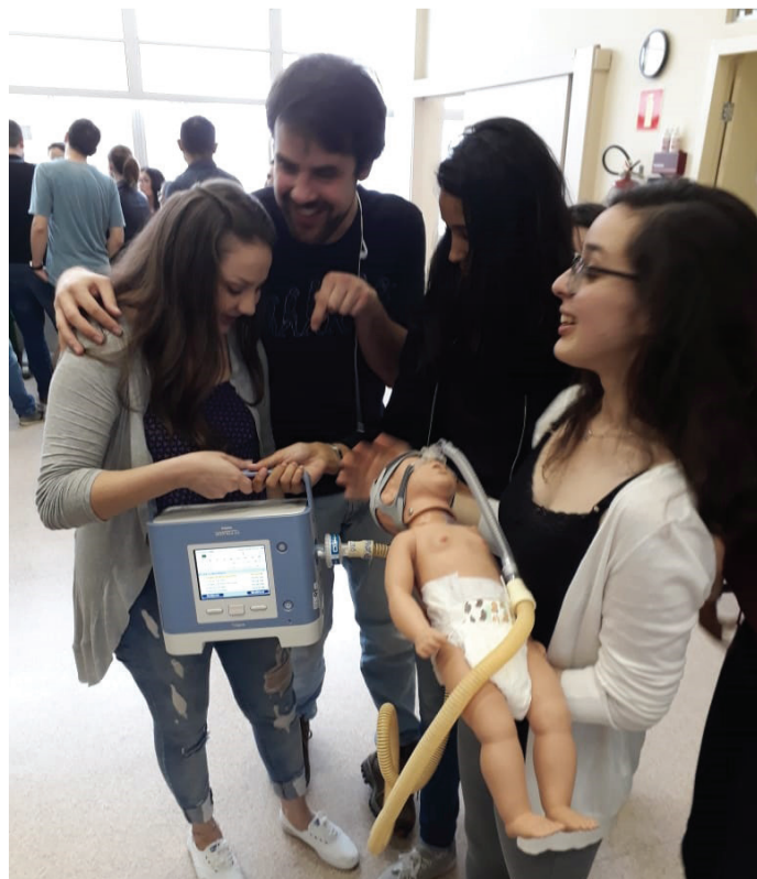
Simulação de procedimento durante o workshop.

Chefe da UNIMULTI – Fisioterapeuta Rauce Marçal