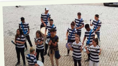
A apresentação da bateria encerrou os festejos de inauguração.