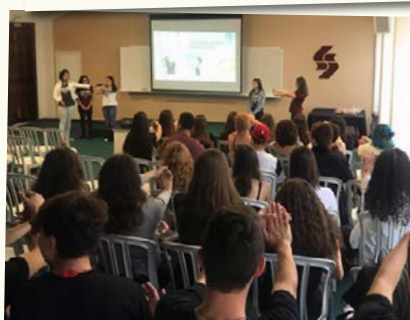
Palestra e dinâmica realizada com alunos e professores.