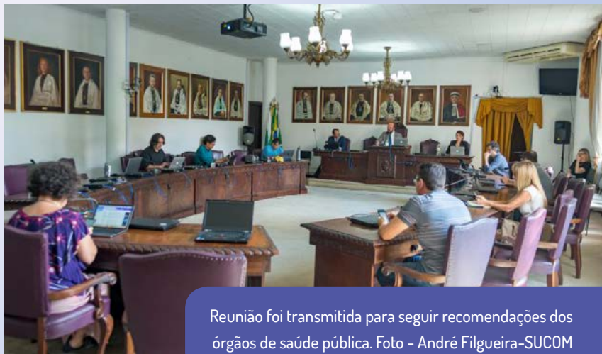
Reunião foi transmitida para seguir recomendações dos órgãos de saúde pública.

Com informações de Érika Amano e Sucom/UFPR